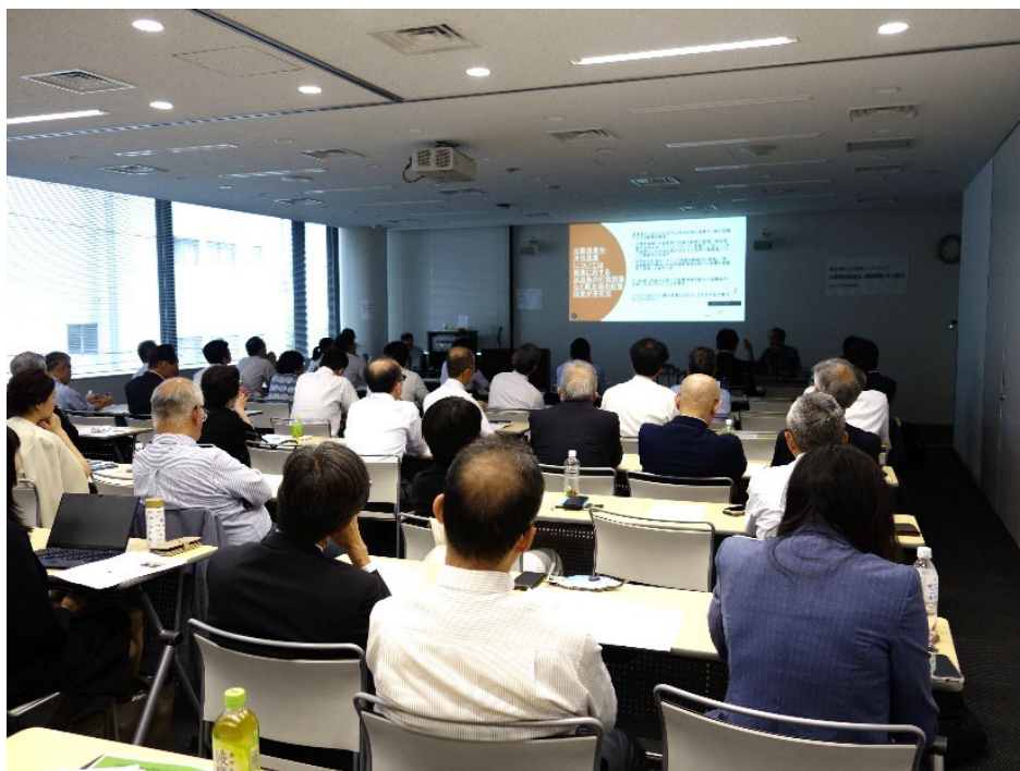
写真1 講演の様子