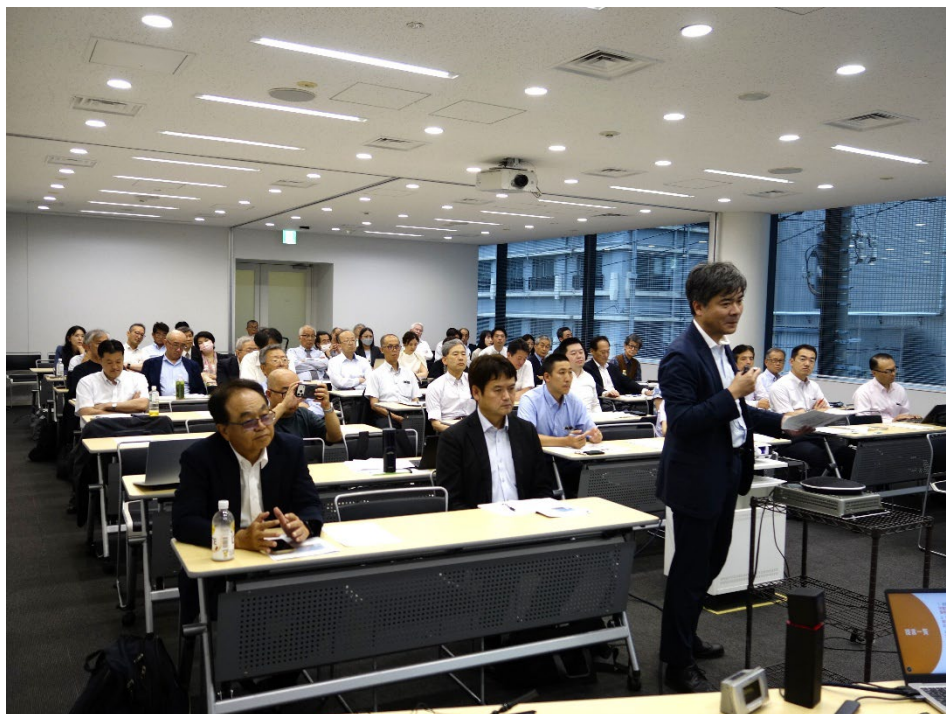
写真2 質疑応答の様子